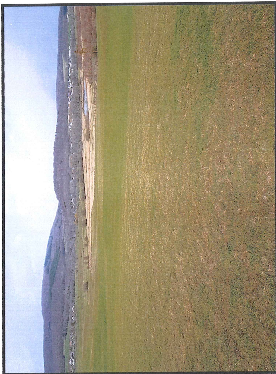
Le terrain de décollage dénommé " Le champ de Rosevaux " à Chalonvillars

Vu pour être annexé à l'arrêté n° 70-2019-06-04-001 du - 4 JUIN 2019