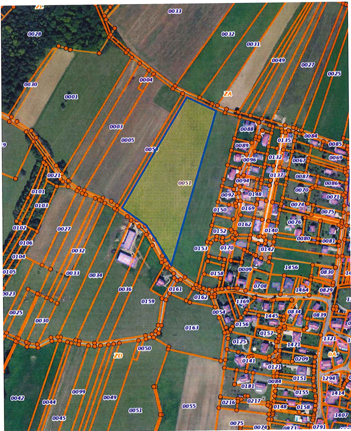
Extrait du plan cadastral & limites de la plateforme de décollage "Mandrevillars" 47°36'59"N 6°46'22"E

Vu pour être annexé à notre arrêté de ce jour